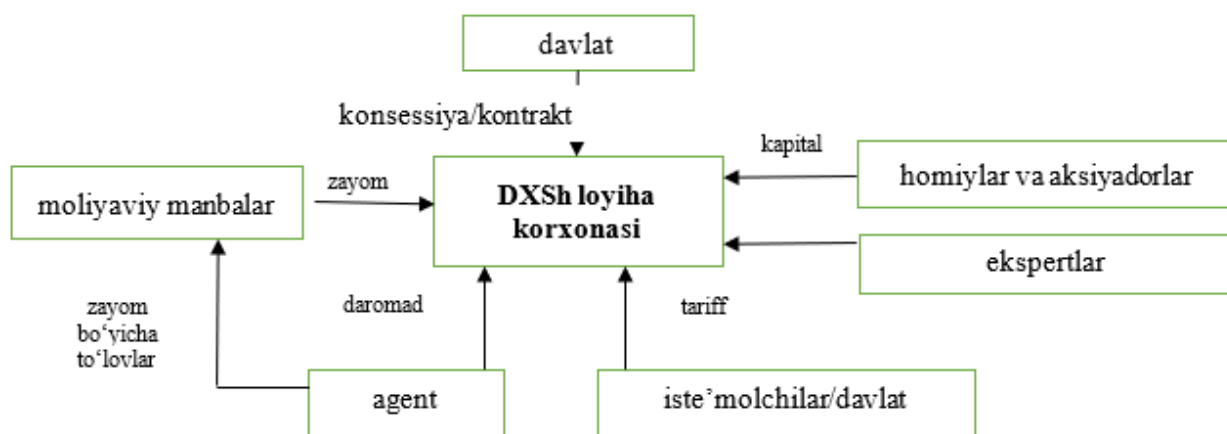
4-rasm. DXSh loyihasining strukturasi 3

- ma'lumotlarning oshkoraligi va haqqoniyligi. Bu omil boshqa investitsiyaviy faoliyat turlarining muhim omili bo'lgani kabi DXSh loyihalarini amalga oshirishda, aytish mumkinki, hal qiluvchi o'rinda turadi. Chunki, investorlar uchun ma'lumotlar to'liqligi, oshkoraligi va haqqoniyligi bozorni chuqur o'rganishga va turli yo'qotishlarning oldini olishga xizmat qiladi.