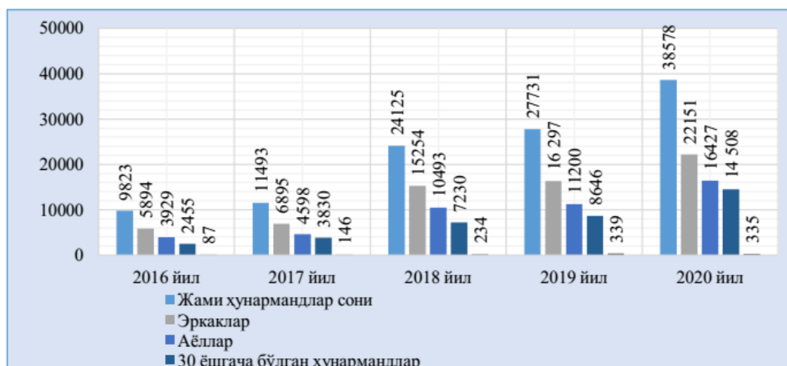
2-расм. Хунарманд уюшмаси аъзоларининг таркиби бўйича маълумот 1

Қузатилган бир қатор камчиликларга қарамай, хунармандлар ва «Хунарманд» уюшмаси фаолияти қайта ислоҳ қилингандан сўнг, соҳа билан боғлиқ кўрсаткичлар мунтазам ўсиб борди. «Хунарманд» уюшмасига аъзо хунармандлар фаолиятини таҳлил қилишда уларнинг жинси, ёши ва ижтимоий ҳолати алоҳида аҳамият касб этади. Уюшма томонидан қайд этилган статистик маълумотларнинг йиллар бўйича чекланганлигини ҳисобга олиб, 2016 йилдан жорий давргача ва кварталлар бўйича сарҳисоб қилишга ҳаракат қилдик. Хунармандлар таркибига эътибор берсак, асосий улушини эркаклар ташкил этаётганлигини кўришимиз мумкин ва уларнинг салмоғи мунтазам равишда ортиб борган. (2-расм)