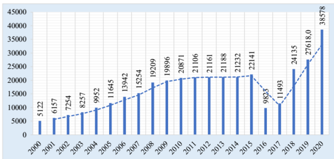
1-расм. Ўзбекистон Республикасида ҳунармандлар сонининг 2000-2020 йиллардаги динамикаси 1

1-расмдан кўришиб турибдики, 2015 йилдан унинг кўрсаткичида пасайиш кузатилиб, 22141 кишини ташкил этган бўлса, 2016 йилда аъзолар сони кескин 12318 кишига камайиб, 9823 кишини, 2017 йилда эса 11493 кишини ташкил этган.